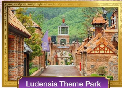
Ludensia Theme Park

• เมนูพิเศษ! ปิ้งย่างเกาหลี, Seafood Hotpot, จิมกัก