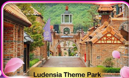
Ludensia Theme Park